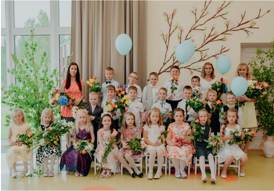
Soinaste lasteaia Laululind Ööbikute rühma lõpetajad.