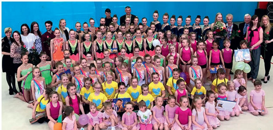
Sellekevadine võimlemispidu pakkus taas elamuse nii osalejatele kui pealtvaatajatele.

17. mail toimus Ülenurmes selle hooaja kevadine oodatud pidu. Ülenurme võimlemispeol gümnaasiumi spordihoones esinesid kõik Ülenurmes tegutsevad võimlemisrühmad ning VK Rütmi rühmad linnast. Etteasted tegid Ülenurme kõige pisemad võimlejad, Eerika Laululinnu lasteaiavõimlemisrühm, külalised Kõrveküla koolist, Ülenurme ettevalmistusrühm ja kõik meie võistlusrühmad – miniklassi rühm, lasteklassi rühm ja juunioriklassi rühm.