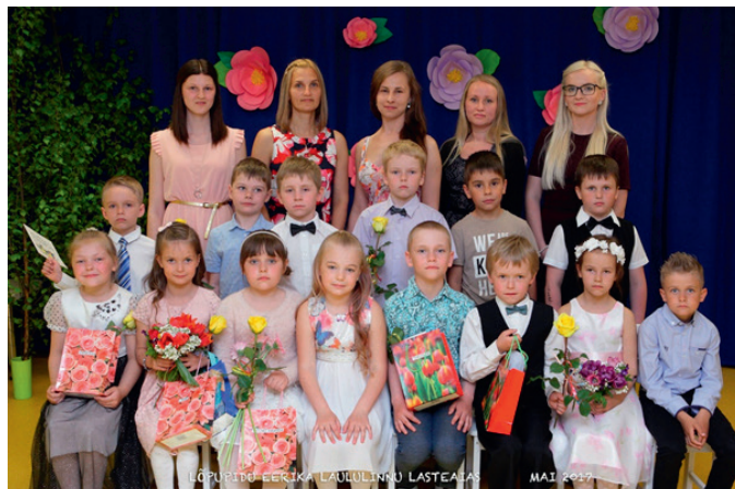
Eerika Laululinnu lasteaia Peoleode ja Lehelindude rühma lõpetajad.