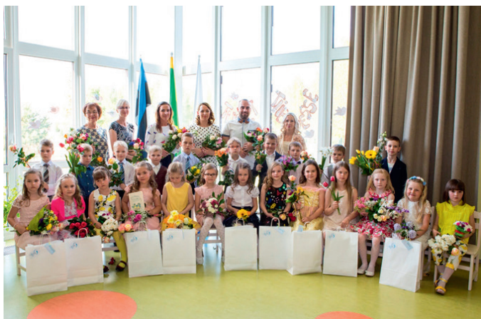
Soinaste Laululinnu lasteaia Kuldnokkade rühma lõpetajad.