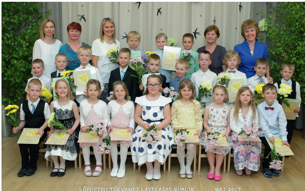
LÕPUPIDU TÕRVANDI LASTEAIAS RÜBLÜK MAI 2017