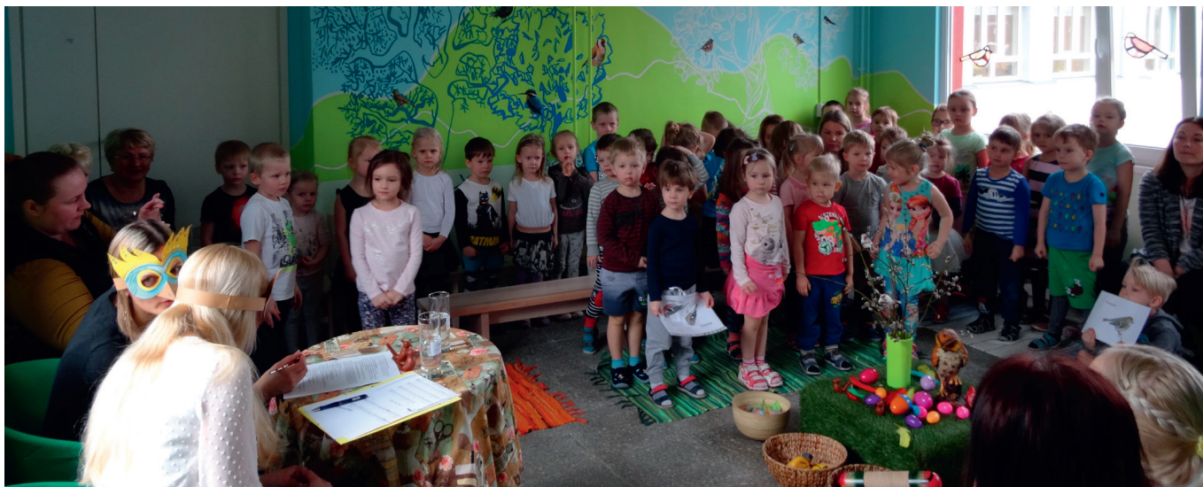
Lindude Lauluhommik Eerika Laululinnus.

Eerika Laululinnu lasteaias on läbi kevade olnud mitmeid toreid üritusi.