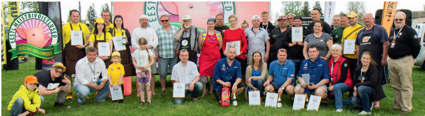
Rõõm kordaläinud päevast ja hästi õnnestunud ettevõtmisest: korraldajad, žüriiliikmed, võistlejad pärast parimate väljakuulutamist.