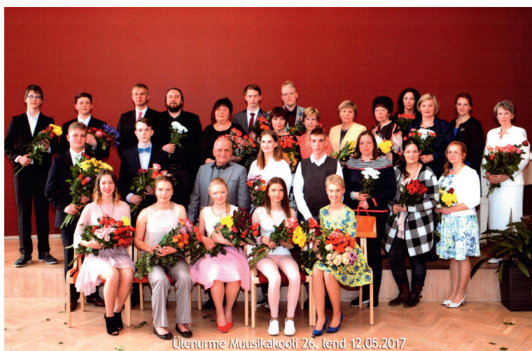
Ülenurme Muusikakooli 26. lend 12.05.2017