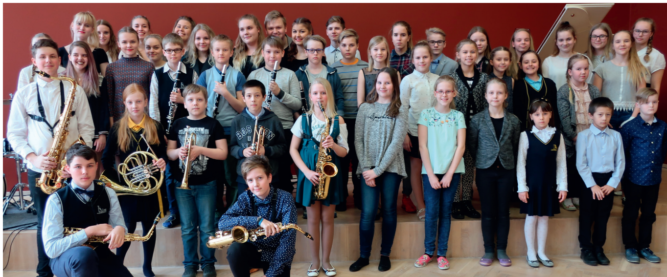
Vabariiklike konkursside võitjad