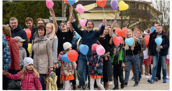
Piilpekiüüde ja rõkkav rongkäik suundumas Uhti kõrtsihoone eest Reola kultuurimaja.

MTÜ Õnnemaa kinkis Ülenurme kogukonnale piduliku rongkäigu ja muusikalise etenduse „Mina Õnnemaal“. Eesmärgiks oli rõõmustada kogukonda ülevaatega Ülenurme ning Tõrvandi Pere- ja noortekeskuste noorte tegemistest. Me soovisime oma kingitusega kokku tuua Ülenurme vallas elavad erinevad põlvkonnad, et koos meie tublide noorte üle rõõmustada ja tähistada ühiselt Eesti riigi 100. juubelisünnipäeva ning emadepäeva.