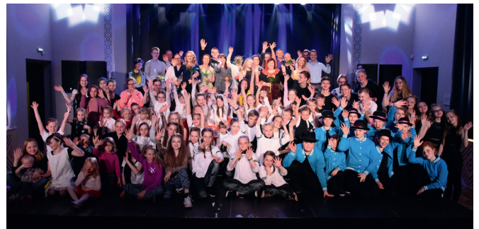
Rõõmurohke ühispilet hästi õnnestunud peo lõpus.