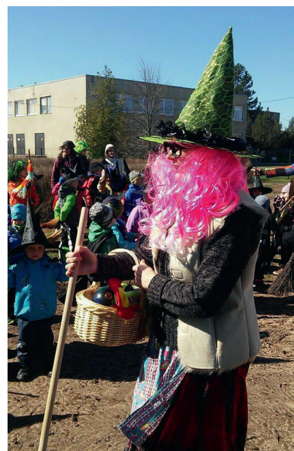
Nõiatrall on täies hoos.