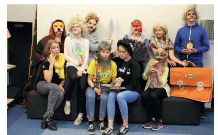
„Võti Vanemuisesse“ – hooaja lõpusündmus teatris Vanemuine