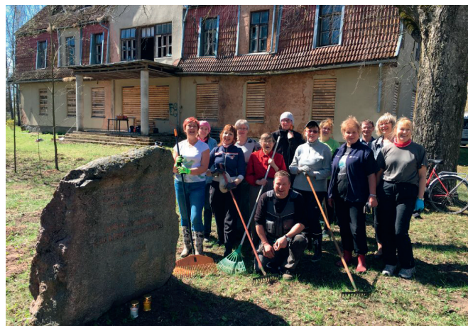
Talguliste ühispilt mälestuskivi juures.