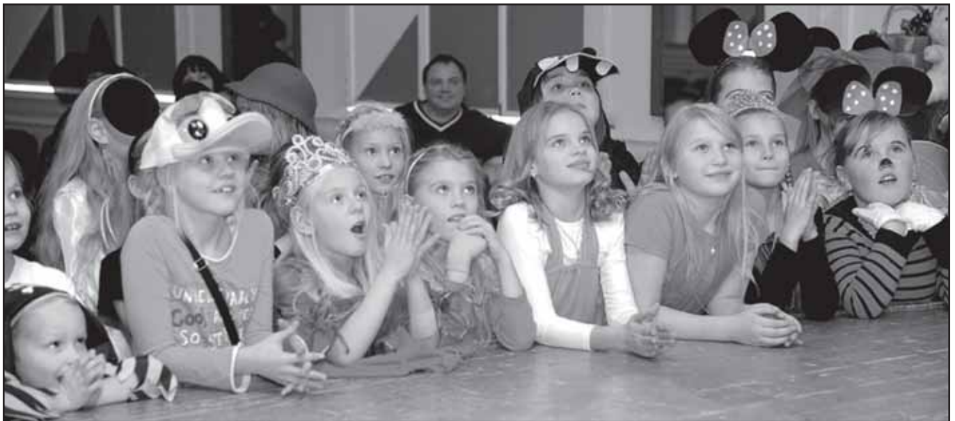
Mustkunstniku trikid hoidsid kõiki evelil.