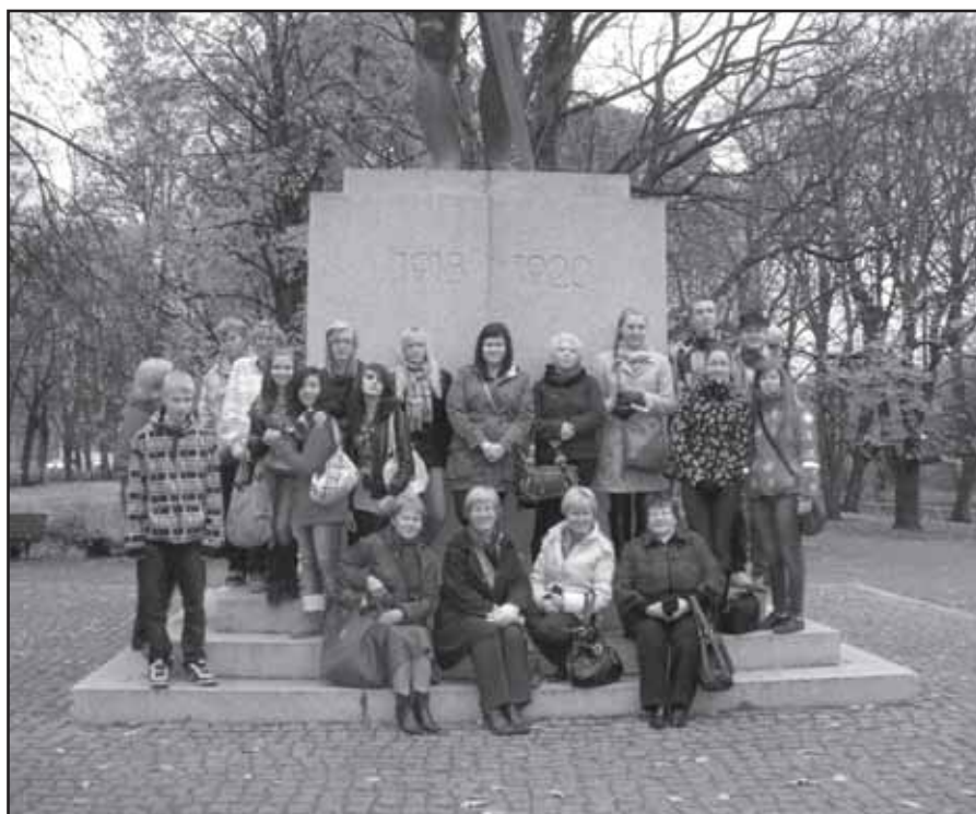
Kahe naabermaa kirjandushuvilised käisid koos Tartu vaatamisväärsustega tutvumas.