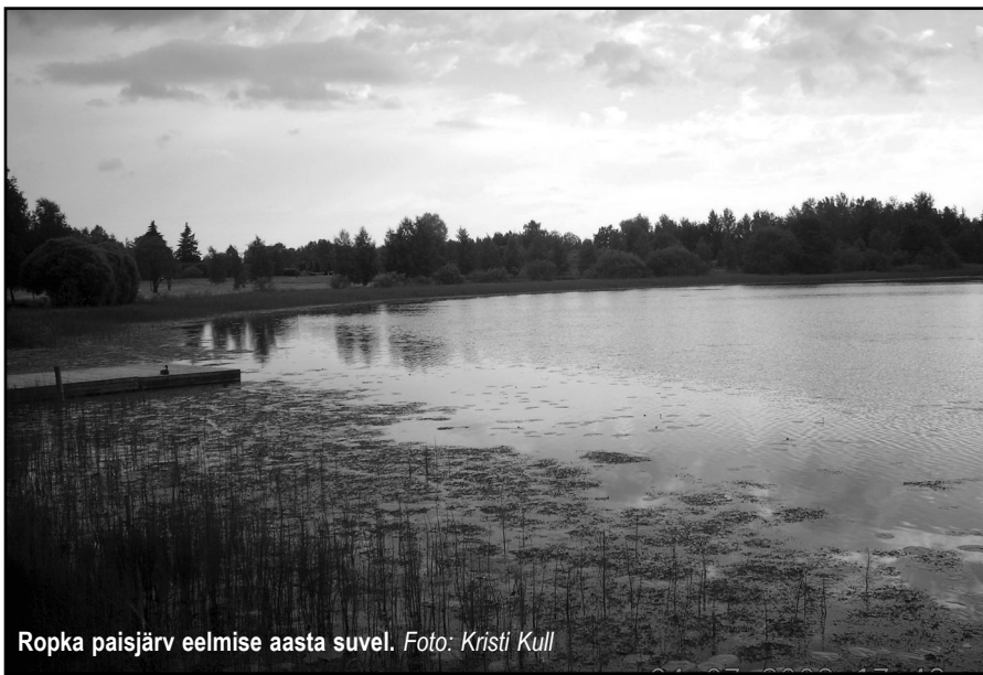
Ropka paisjärv eelmise aasta suvel.

KRISTI KULL, Ülenurme valla keskkonnaspetsialist