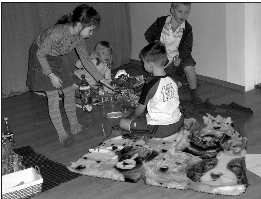
Kassiaasta piknik on täies hoos – jagatud rõõm on kõige suurem rõõm!

Tõrvandi Rübliku lasteaia Mesilaste rühm on üks rakuke maailmast. Ja nii nagu kogu maailm otsustasime ka meie tähistada Hiina horoskoobi järgi valge kassi (jänese) aasta algust. Kuna ootame juba meeletult suve saabumist pärast seda pikka ränka talve, siis toimus üritus piknikuvormis. Pidime väikeste mudilastega kasutama rohkelt fantaasiat. Näiteks muruvaibale mineku asemel toimus väljasõit lasteaia saali. Panime lastega saali põrandale maha nende kodust toodud piknikutekid, mis tekitas suvise meeleolu. Sissepääsupiletiks oli kodust kaasa võetud pehme karvane kass või jännes.