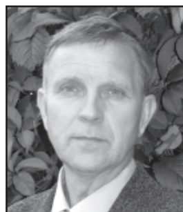
110. Aleksandr Suvorov