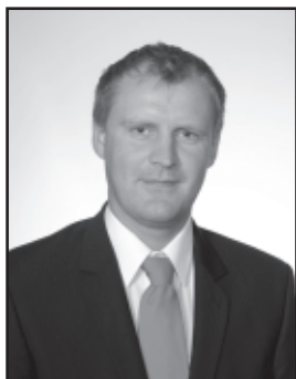
124. Raivo Sammel