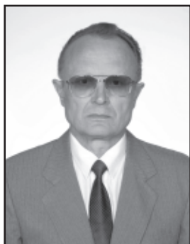
119. Anti Kalvet