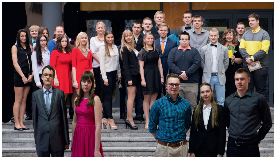
12.b, esiplaanil hõbedane duo ja kuldne trio