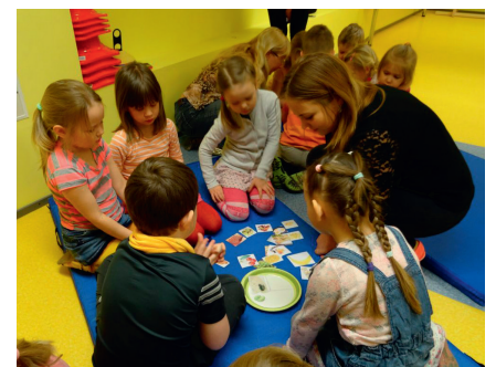
Tervislikku taldrikutäit koostamas.

Seejärel mängisime teatevõistlust „Õiged toiduained õigesse ringi”. Võistlus toimus kahes rühmas ning võistluse eesmärk oli kõik toiduained viia lõpp-punkti punasesse või rohelisse ringi. Punasesse võis asetada need toiduained, mida ei tohiks iga päev tarbida, ja rohelisse ringi läks see toit, mida just iga päev oleks arukas süüa. Kõik olid väga tublid ning enamus toiduaineid asetati õigesse rõngasse.