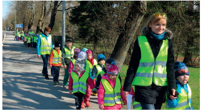
Laululinna lasteaia tervisematk

Tervishoid on Laululinna lasteaias vaieldamatult oluline. Tervise edendamine käib igapäevaste tegevuste abil, nagu tervislik toitumine, aktiivne liikumine ja rahuliku uneaja tagamine. Aprillikuus pöörasime erilist tähelepanu just aktiivsele liikumisele, mis omakorda soodustas head söögiisu.